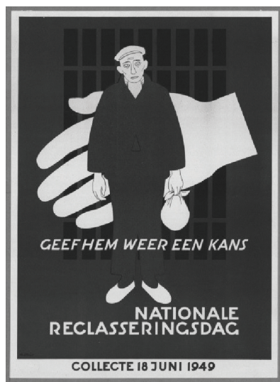
Figuur 3 Affiche Reclaseringsdag. Van circa 1920 tot het begin van de jaren zestig werd een jaarlijkse collecteweek gehouden om geld in te zamelen voor de reclassering